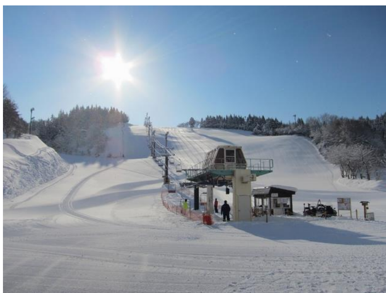
(そうまロマントピアスキー場 ゲレンデ)