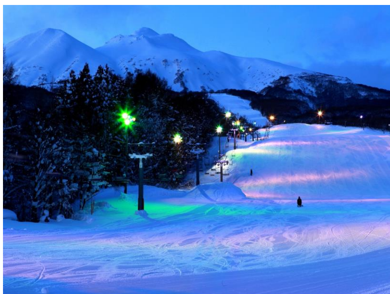
(岩木山百沢スキー場 ゲレンデ)